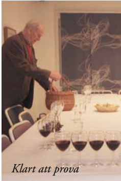
Klart att prova