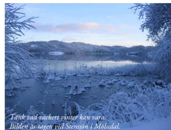
Tänk vad vackert vinter kan vara. Bilden är tagen vid Stensjön i Mölndal.

Red. önskar alla på Nilssonsberg en riktigt