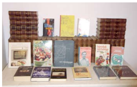
några av bokbytardagens utbud

Grillkväll blir det den 27 maj och bokbytardagarna fortsätter framöver, en söndagseftermiddag varje månad.