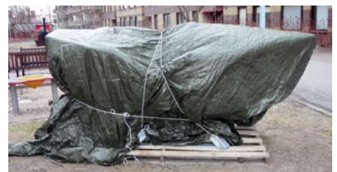
Vad döljer sig under presseningen?

Båtinvgning - som ni föräldrar till unga båtentusiaster säkert märkt står det en mystisk presseningstäckta farkost där den gamla båten stod, vid nergången till Västergatan 5. Det är många små som nyfiket kikat in under och försökt få en glimt av vad som döljer sig. Vi tänkte inviga båten så snart den kommit på plats, med både bulle och saft. Mer information kommer upp i trappuppgångar och på vår webbplats så snart ett datum är bestämt.