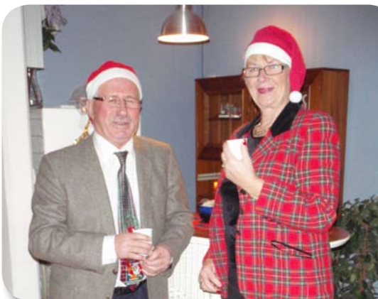
Välkända medlemmar av Kärnankommittén