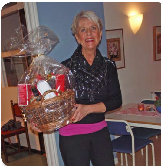
Lycklig vinnare vid Lussekaffe