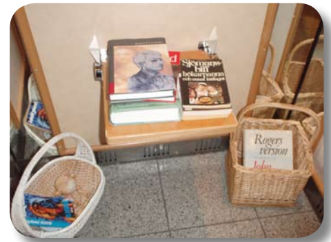
Bokbyte i hissen

Det blir bokbytardag söndagen den 4 april. Bokbytardagar har det varit flera stycken under hösten och vintern, några riktigt välbesökta. Som kuriosita i detta sammanhang har jag noterat att man i hissen på NB 14 byter böcker med varandra, se bilden. Måhända för att göra hissturen lite lättsammare.