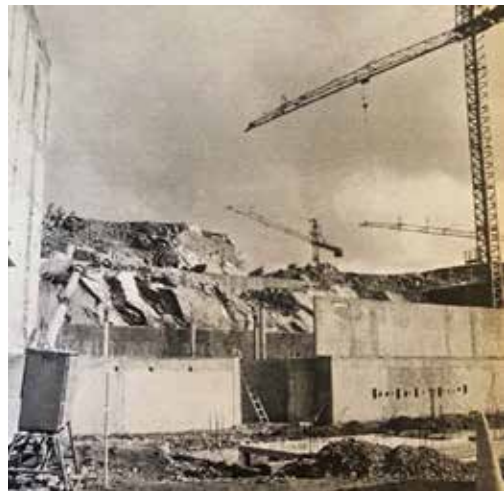
Så såg det ut på byggarbetsplatsen Nilssons Berg i Göteborg i början på april. Tomt. Bygget hade avbrutits i brist på pengar.