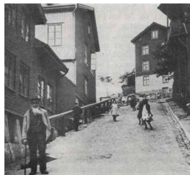
Det var toppen tyckte man då. År 1930

En gång kasade både häst och gubbar ner för slänten, hästen klarade sig men kärran dök in i finrummet på Klockaregatan 5, de va ingen grann tavla de, rummet låg i höjd med gatunivån, som var terrasserad.