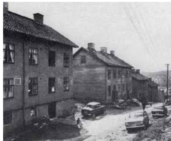
Fin utsikt över den väl kuperade "gatan"

Komforten och de hygieniska apparaterna voro ganska så enkla, konstigt att folk har överlevt den standarden som då fanns, baciller, råttor och pankor levde ganska så bra i hop och härdade folk, en del dog unga och flera från barndomens Nilssonsberg lever ännu, ett biologiskt under.